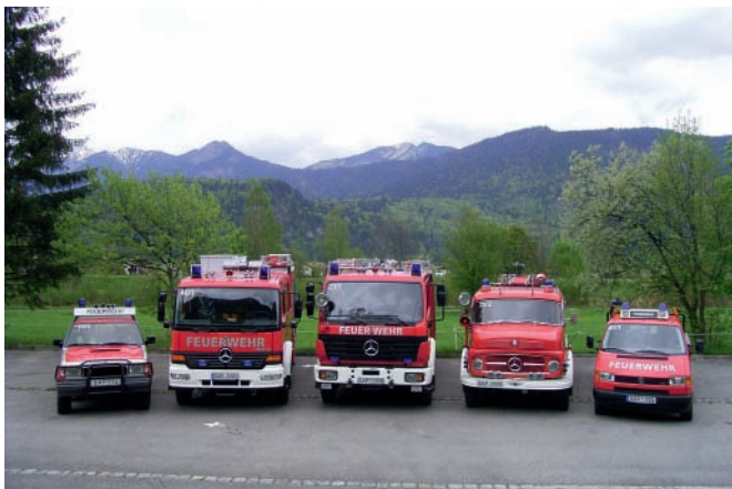
Foto: derzeitiger Fuhrpark

Dies wurde auch durch die große Eigenleistung der Mitglieder ermöglicht. Zeitgleich mit dem Umzug ins neue Heim konnte die Wehr auch das erste Tanklöschfahrzeug (TLF), das gebraucht von der Patenwehr Partenkirchen übernommen wurde, sein eigen nennen. Dieses wurde 1998 durch ein neues TLF ersetzt. 2005 wurden die beiden Fahrzeuge von 1974 und 1980 durch ein modernes LF 16/12 ersetzt, das vor allem durch die vielfältige Ausrüstung zur technischen Hilfeleistung auf die sich ständig wandelnden Aufgaben der Feuerwehr zugeschnitten ist.