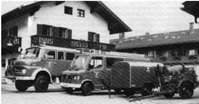
Foto: Fahrzeuge 1986

1974 konnte das erste Löschgruppenfahrzeug (LF) ein LF 8 eingeweiht werden. 1980 folgte als Ersatz für den in die Jahre gekommenen Ford ein Tragkraftspritzenfahrzeug. Bis in die 80er Jahre des 20. Jahrhunderts waren die Geräte im alten Gerätehaus, der jetzigen evangelischen Kirche, untergebracht. Nach langer Suche und zähen Verhandlungen konnte in den Jahren 1989/90 das jetzige Gerätehaus neu- und umgebaut werden.