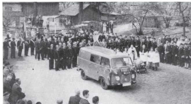
Foto: Erstes Fahrzeug

Auch die Ausrüstung der Feuerwehr hat sich im Laufe der Jahre gewandelt. Am Anfang stand lediglich eine Handdruck-Spritze zur Verfügung. Im Jahr 1936 wurde die erste Motor-Spritze beschafft. 1960 wurde das erste Fahrzeug, ein Ford Transit, in Dienst gestellt.