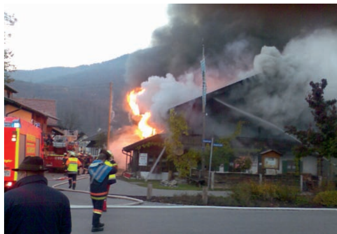
Foto: Einsatz in Farchant

In den Jahren seit der Gründung der Freiwilligen Feuerwehr Farchant hat sich das Einsatzspektrum gewandelt: Heute ist die Hauptaufgabe die Technische Hilfeleistung, angefangen von der Ölspur über das Hochwasser bis hin zum Unfall mit eingeklemmten Personen. Die Brandbekämpfung ist immer mehr in den Hintergrund gerückt.