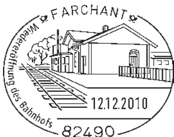
Abbildung: Sonderstempel zur Wiedereröffnung des Bahnhofs in Farchant

Der Sammlerclub hat weiter eine eigene amtliche Ganzsache (Brief mit eingedrucktem Wertzeichen) in einer Auflage von 250 Stück geschaffen, die es deutschlandweit nur heute in Farchant gibt. Ferner ist eine Reproduktion einer alten Postkarte mit dem Motiv Bahnhof geschaffen worden. Die Umschläge wurden in Zusammenarbeit mit dem Heimatverein Forcheida gestaltet. Dazu gibt es die Sondermarke zum 175-jährigen Eisenbahnjubiläum.